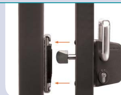
Zeker en snel sluitbaar